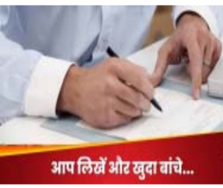
आप लिखें और खुदा बांचे...