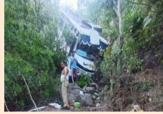
की आवाजाही की सूचना मिलती रही है।

जांच शुरू कर दी थी। स्थानीय लोगों के अनुसार, बस शिव खोरी के पास रनसू से कटरा शहर जा रही थी, जो त्रिकुटा पहाड़ियों में वैष्णो देवी मंदिर के लिए आधार शिविर के रूप में कार्य करता है। स्थानीय लोगों ने बताया कि जम्मू-कश्मीर पंजीकरण संख्या वाली बस कई तीर्थयात्रियों को ले जा रही थी। प्रारंभिक रिपोर्टों से पता चलता है कि दो नकाबपोश आतंकवादियों ने गोलीबारी की, जिससे कांडा चंडी मोड़ के पास चालक को चोट लगी और वाहन खाई में दुर्घटनाग्रस्त हो गया। यह इलाका रियासी और राजौरी जिले की सीमा पर पड़ता है और पहले भी यहां आतंकियों