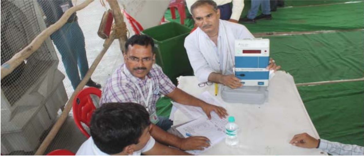
गल्ला मंडी कानपुर में इस तरह हुई ईवीएम से गिनती