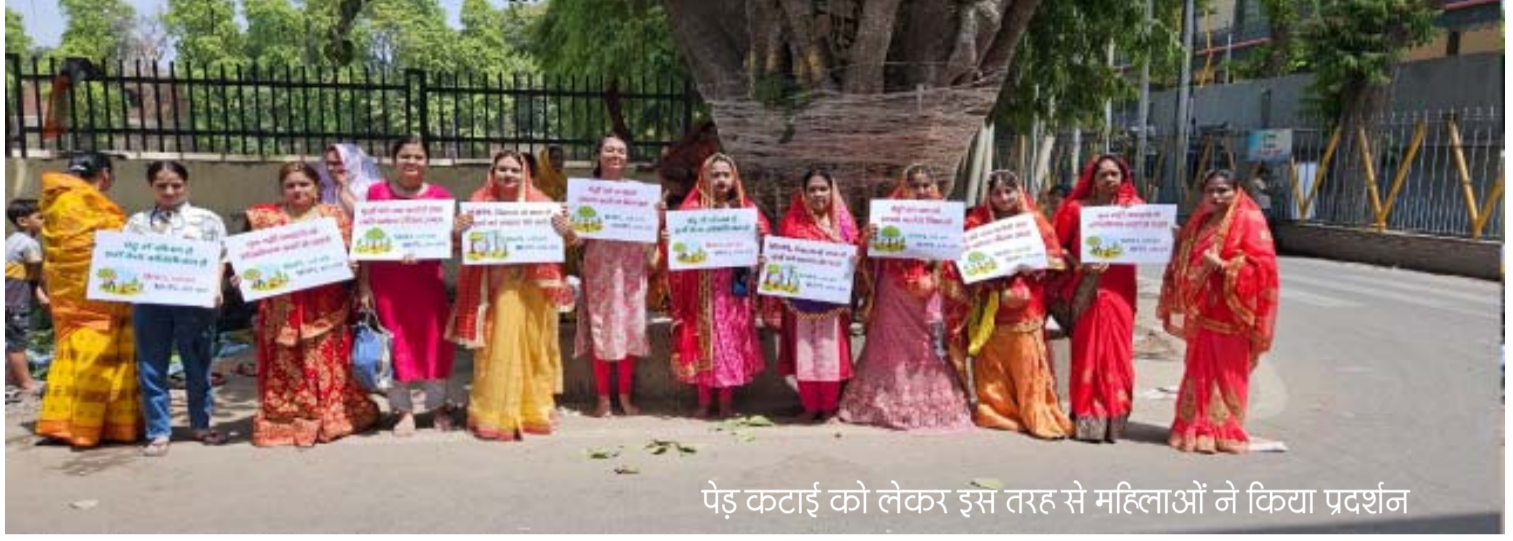
पेड़ कटाई को लेकर इस तरह से महिलाओं ने किया प्रदर्शन

◀ बृजेंद्र स्वरूप पार्क स्थित टीएसएच स्टेडियम में 80 से अधिक हरे भरे पेड़ काटने से नाराज इलाकाई नागरिक ◀ विश्व पर्यावरण दिवस पर भाजपा युवा मोर्चा के पदाधिकारियों ने किया वृक्षारोपण ◀ विकास कार्य के नाम पर कानपुर महानगर में काटे जा रहे बड़े बड़े पेड़