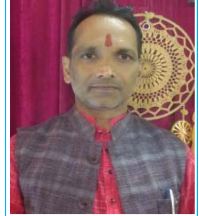
नववर्ष व मकर संक्रांति की हार्दिक शुभकामनाएं (बी.पी. साहू - संपादक)