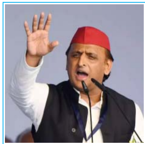
महाकुंभ में इंतजामों को लेकर अखिलेश ने उठाए योगी सरकार पर सवाल