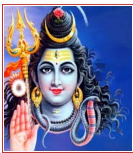
महाशिवरात्रि की हार्दिक शुभकामनाएं