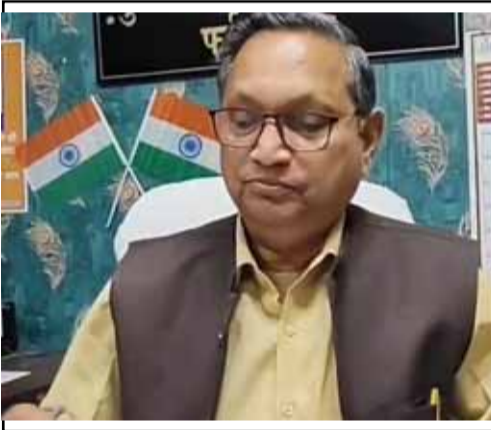
लापरवाही में कुलवंती हॉस्पिटल सीज किया गया

संज्ञान लिया। उन्होंने अपर मुख्य चिकित्सा अधिकारी के नेतृत्व में तीन सदस्यीय जांच टीम गठित कर अस्पताल की गहन पड़ताल के निर्देश दिए। टीम ने अस्पताल की ऑपरेशन थियेटर (ओटी) सहित अन्य व्यवस्थाओं की जांच की। प्रारंभिक जांच में सर्जरी से संबंधित