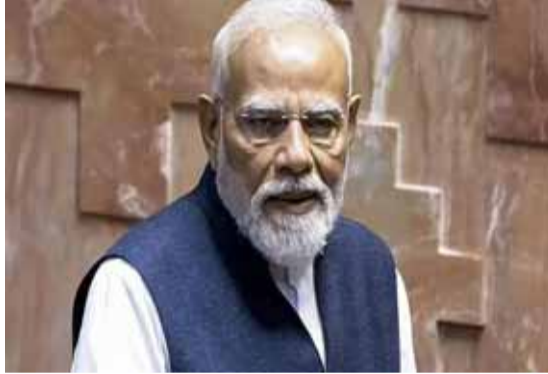
अपने विचार साझा किए।

नयी दिल्ली। प्रधानमंत्री नरेंद्र मोदी ने रविवार को अपने मासिक रेडियो कार्यक्रम मन की बात के 133वें एपिसोड में देश को संबोधित किया। इस दौरान पीएम ने भारत के परमाणु कार्यक्रम और पवन ऊर्जा में मिली बड़ी सफलताओं पर गर्व जताया। उन्होंने कहा कि देश के वैज्ञानिक लगातार राष्ट्र निर्माण में अहम योगदान दे रहे हैं। पीएम ने इसके साथ ही भारतीय संस्कृति, आने वाले त्योहारों और तकनीक के बढ़ते प्रभाव पर भी