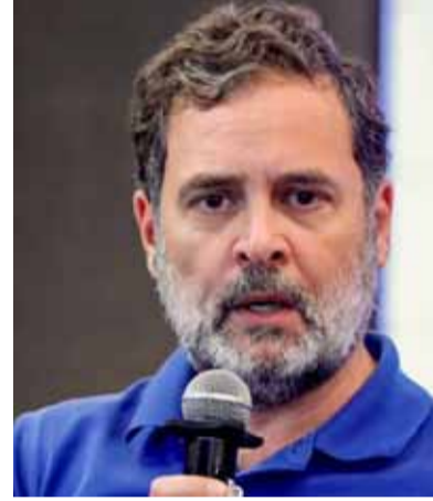
बंगाल में लोकतंत्र की जगह गुंडराज चल रहा है,

राहुल गांधी ने सोशल मीडिया प्लेटफॉर्म एक्स पर पोस्ट साझा कर कहा कि चुनाव के बाद टीएमसी से जुड़े गुंडों द्वारा की गई यह हत्या बेहद निंदनीय है। उन्होंने आरोप लगाया कि पश्चिम